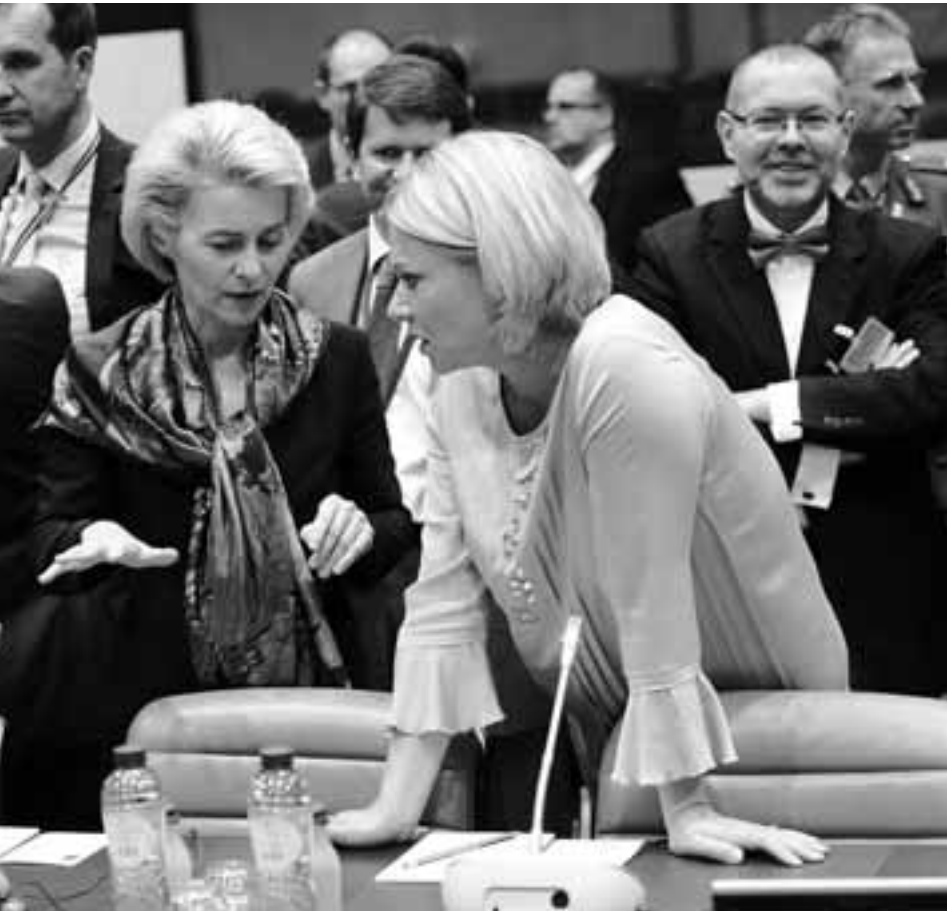
RECHTS: MINISTER VAN DEFENSIE JEANINE HENNIS-PLASSCHAERT, LINKS HAAR DUITSE COLLEGA URSULA VON DER LEYEN, BIJENKOMST NAVO DEFENSIEMINISTERS - BRUSSEL, 24-25 JUNI 2015

groep, de Joint Expeditionary Force (JEF), staat de ondersteuning van Britse militaire interventies buiten het NAVO-gebied centraal. De leden zijn naast Engeland: Denemarken, Estland, Letland, Litouwen, Nederland en Noorwegen, dus een aantal van de noordwestelijke Europese kuststaten. Een informatief Research Paper van het NATO Defense College in Rome, waaraan veel van de hier vermelde gegevens zijn ontleend, ziet deze samenwerking als een vervolg op de tijdens de Afghanistan-oorlog (2004-2014) en de Libië-oorlog (2011) ontstane binding. Als operationeel commandocentrum treedt het UK Standing Joint Force Headquarters in Northwood op, gevestigd in een westelijke buitenwijk van Londen.