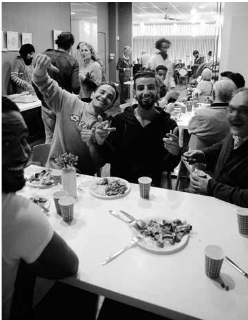
CAFÉ WELKOM IN BUITENVELDERT