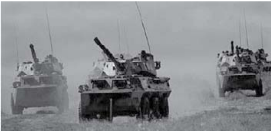
Pantseroefening tijdens SCO-oefening Peace Mission 2007

De Sjanghai Five was vooral opgericht om grensconflicten op te lossen en tegen de "drie kwaden" (terrorisme, extremisme en separatisme) op te treden om te voorkomen dat islamitische landsdelen, als Tsjetsjenië en Xinjiang zich met steun van Westerse geheime diensten zouden afsplitsen. Maar ook in Kazachstan, Kirgizië en Tadjikistan bedreigden religieus-politieke leiders de lokale autoriteiten van deze jonge landen die nog maar kort geleden waren afgesplitst van de Sovjet-Unie en zelfstandige staten geworden waren. Deze religieus-politieke bewegingen werden gesteund door Pakistan, Saoedi-Arabië en de Verenigde Staten. Zoals prof. Michel Chossudovski concludeerde: "de