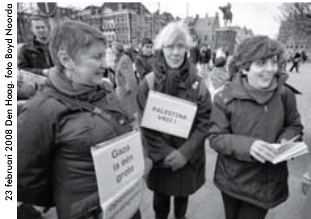
23 februari 2008 Den Haag

Zo'n 200 mensen waren zaterdag 23 februari aanwezig op de manifestatie Gaza open, muren slopen op het Buitenhof, die georganiseerd was door het Palestina Komitee, de Palestijnse Gemeenschap Nederland en I.S. In ongeveer dertig steden in de wereld vonden op dezelfde dag manifestaties plaats om aandacht te vestigen op het Israëliëse beleg van het dichtbevolkte gebied. Bombardementen, voedseltekort en gebrek aan medicijnen hebben de afgelopen maanden aan honderden Palestijnen het leven gekost.